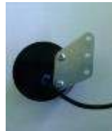
2. Buzzer Sentinel 110dB