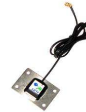
4. Antenne GPS L. : 1,5m