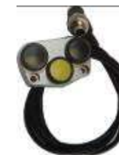
Télécommande déportée en option

Les véhicules doivent se présenter équipés aux vérifications