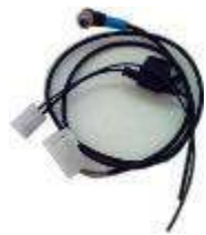
3. Câble alimentation Comprend : câble + porte-fusible

Ref. SUPC 201 Ref. SONO 206 Ref. CALC 902 Ref. ANTEC 201 Ref. AESE 206