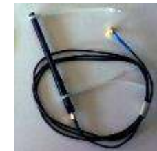
5. Antenne radio Sentinel