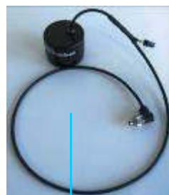
5. Buzzer Sentinel 110dB