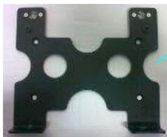
1. Support Dimensions : 180 x 155 x 24mm