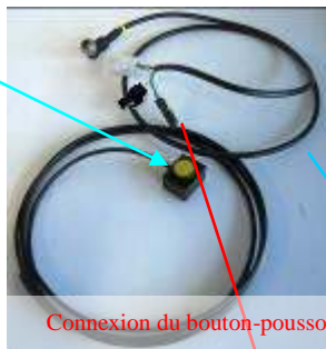
4. Câble alimentation Comprend : câble / porte-fusible 3A