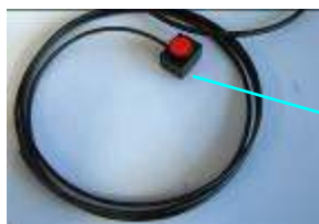
2. Bouton Alarme Sentinel rouge