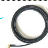
7. Câble antenne GPS L. : 3m